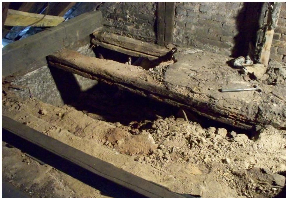
Bild 3: Geöffneter Fußboden der Wohnung oberhalb des Chorraums, Blick in das Chorgewölbe begrenzt durch den Schutt

Bei den Außensanierungsarbeiten in den Jahren 2007 – 2010 wurde auch der Chorraum grundlegend saniert, denn die Einbauten des 19. Jahrhunderts drückten auf das Gewölbe.