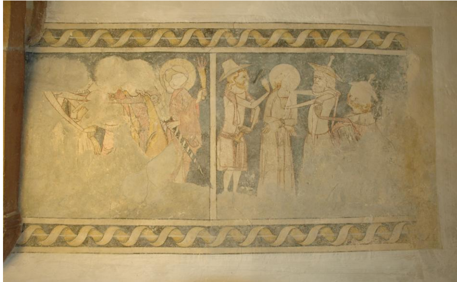
Bild 5: Die Gefangennahme Jesus (links) und das Urteil des Pilatus (rechts)

Das folgende Bild zeigt Christus vor Pilatus. Zwei Schergen bringen den gefesselten Christus zu Pilatus, der am rechten Bildrand sitzt und den linken Arm ausgestreckt hat. Dargestellt ist der Augenblick der Freigabe Christi zur Kreuzigung.