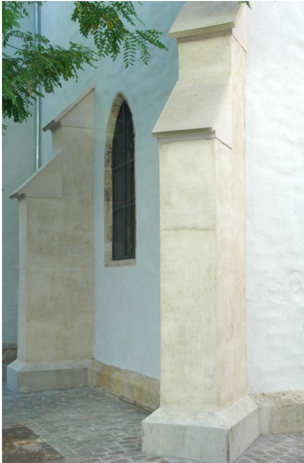
Bild 4: Moderne Strebe Pfeiler auf mittelalterlichen Fundamenten an der Südwand des Chors

Eindeutig hingegen ist, dass die heutige Langhausform auf die Umbauten um 1849 zurückzuführen ist. Verschiedene Restaurierungsmaßnahmen in der Folgezeit, angefangen von Veränderungen im Zuge der erneuten Weihe 1872 bis hin zum Abbruch