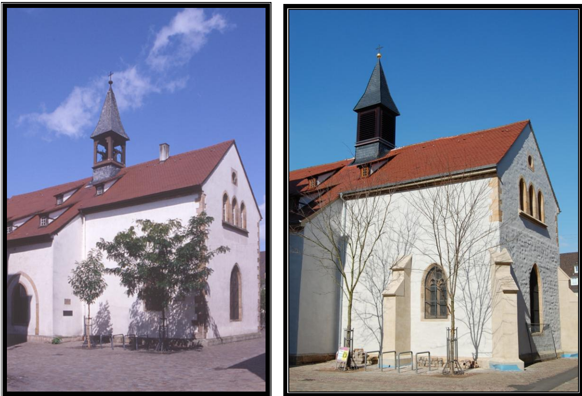
Bild 12: Links die Kapelle vor und rechts nach der Außensanierung mit den drei neuen Strebepeilern, dem neuen Putz, der das alte Gemäuer betont, dem generalsanierten Dach mit neuem Dachreiter und vergoldetem Kreuz

Die Voruntersuchungen sind geleistet, Förderverein und Stadtverwaltung sitzen in den „Startlöchern“. Über den „Startschuss“ entscheiden interessierte und spendenwillige Bürgerinnen und Bürger aus Landau und Umgebung.“ Soweit der Text von 2006.