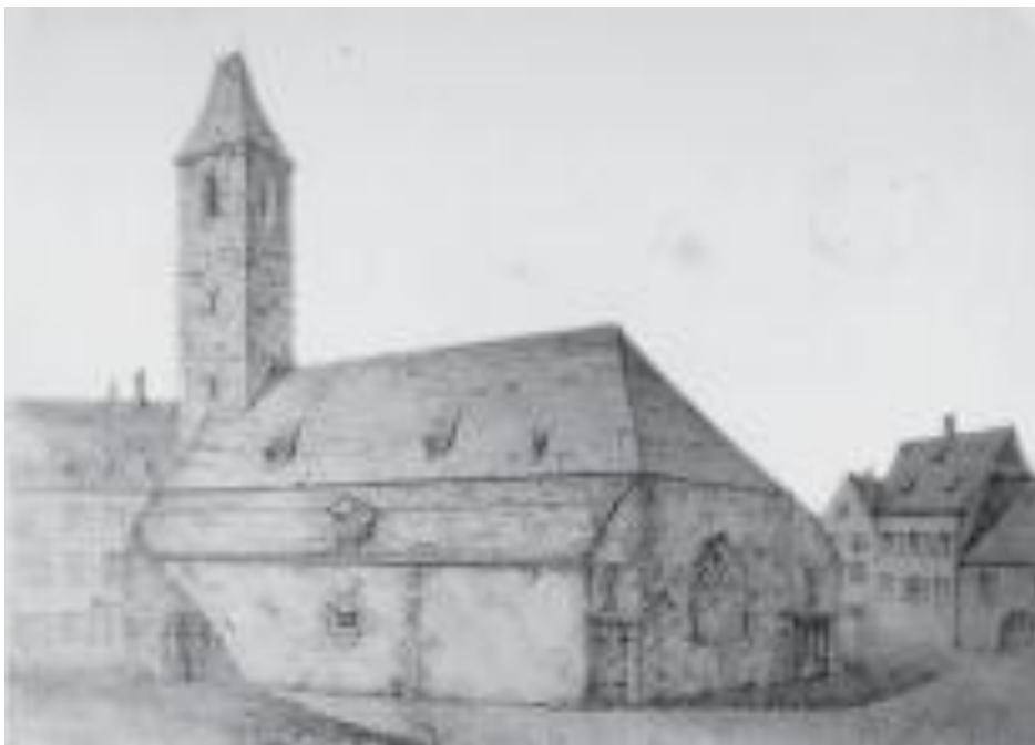
Bild 1: Die Zeichnung des Bauschaffners Mayer (vor 1849) zeigt die Kirche vom Südosten mit den Remisen zu beiden Seiten des Chors und den um 1850 abgerissenen Turm. 1

Die Katharinenkapelle lässt im Erscheinungsbild ihre bewegte Nutzungsgeschichte erkennen: Sie wurde als Gotteshaus der Beginen, einer halbklosterlichen Frauenvereinigung, die sich in der Krankenpflege engagierte, geweiht, im Zuge der Reformation profaniert und dennoch seit der Mitte des 17. Jahrhunderts jeweils in den Wintermonaten als Totenkapelle genutzt. Ab 1680 folgt die kurze Episode der Aufwertung als französische Garnisonskirche und simultane städtische Hauptkirche für die im Spanischen Erbfolgekrieg beschädigte Stiftskirche, sodann die Profanierung und allmähliche Degradierung bis hin zum Heuspeicher und Markthalle im 19. Jahrhundert.