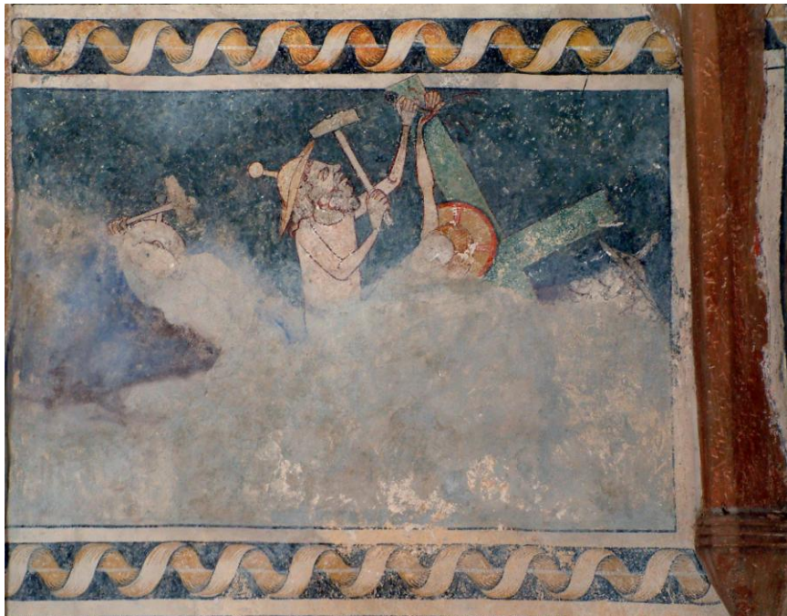
Bild 6: Jesus wird ans Kreuz genagelt - die Schergen tragen einen Judenhut, wie er für das Spätmittelalter typisch ist.

Das folgende Bild zeigt Christus vor Pilatus. Zwei Schergen bringen den gefesselten Christus zu Pilatus, der am rechten Bildrand sitzt und den linken Arm ausgestreckt hat. Dargestellt ist der Augenblick der Freigabe Christi zur Kreuzigung.